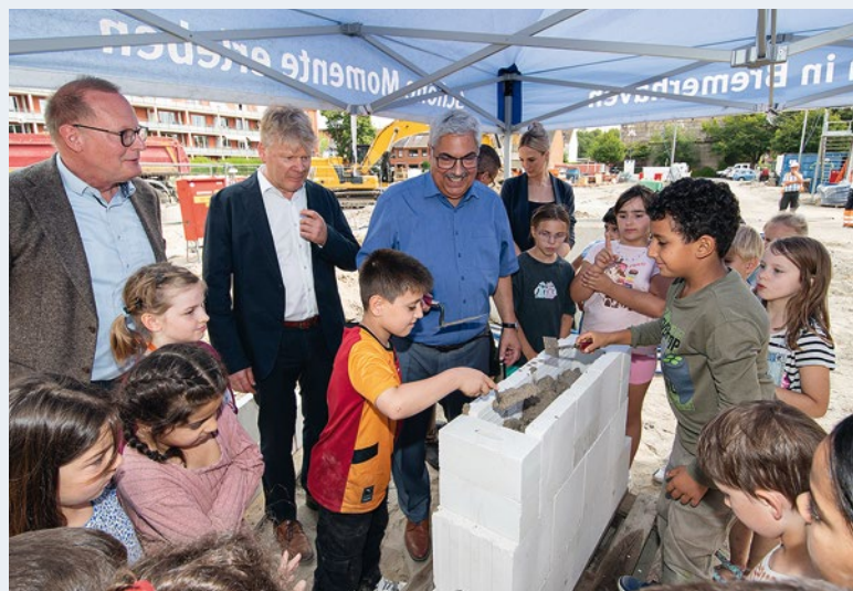
Alle anpacken: Grundsteinlegung für die Neue Grundschule Lehe

Ortswechsel: Der Rohbau ist fertiggestellt, mit dem Elektro- und Trockenbau wurde schon längst begonnen und im Erdgeschoss sind bereits die Fenster eingesetzt. „Das Richtfest des Schulzentrums Hamburger Straße markiert zusammen mit der Grundsteinlegung der Neuen Grundschule Lehe einen großen und freudigen Tag für Bremerhaven“, so Oberbürgermeister