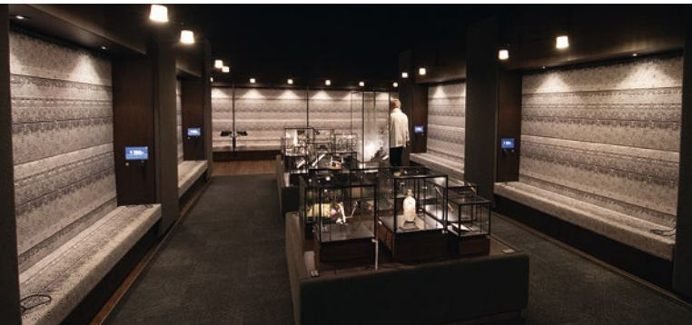
Das ehemalige Hafenamts und das Deutsche Auswandererhaus