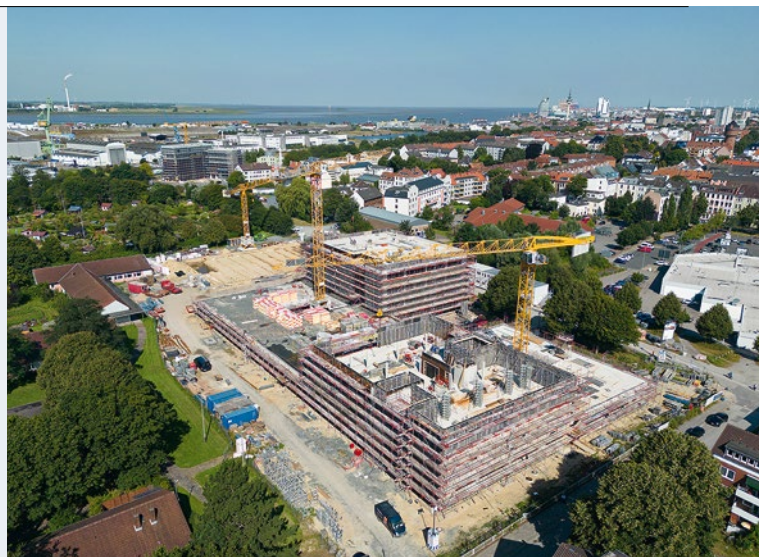
Ebenfalls im Zeitplan: Das Schulzentrum Hamburger Straße (SHS)

Die insgesamt sechs Etagen – vier Etagen für die Polizei, eine für die Landesbeauftragte für Datenschutz und Informationsfreiheit (LfDI) plus ein Technikgeschoss – beeindruckt bereits als Rohbau. Dazukommen werden noch eine Carportanlage für die Dienstfahrzeuge und ein Stadtplatz, der dann auch öffentlich zugänglich ist. Am Eingang zum geplanten „Werftquartier“ dürfte das klimaneutrale Gebäude zukünftig das erste Polizeirevier in Deutschland sein, das