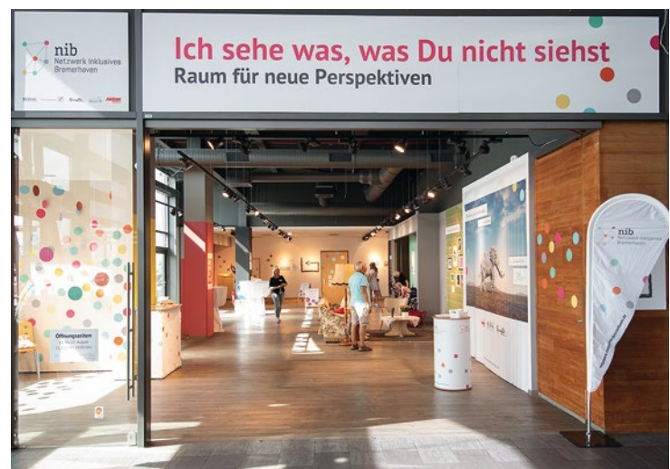
Eine Kooperation mit dem Netzwerk Inklusives Bremerhaven

„Es ist toll, dass wir von hier aus sogar einen Blick auf den Alltag haben“, fährt die Moderatorin fort und bleibt am Seitenfenster zum Alten Hafen, zur Columbusstraße und zur Glasbrücke stehen. „Hier kann man die Barrieren und Probleme notieren, die im Umkreis von nur wenigen Metern zu erkennen sind“, erklärt sie und deutet auf die beschrifteten Scheiben. Eine viel befahrene Straße, die Wendeltreppe, der kaum gesicherte Übergang zum Wasser, Lärm und rutschige Pflastersteine – alles eine Frage der Perspektive. ■