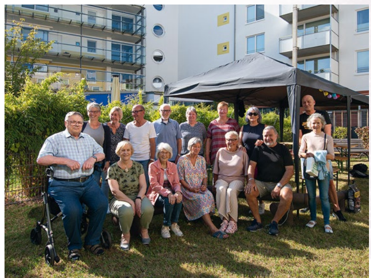
Bratwurst und gute Laune: Sommerfest in der Nürnberger Straße

Haus – in unserem Sozialraum oder bei schönem Wetter draußen.“ Zehn Personen gehören zum Stammtisch, rund die Hälfte der Hausbewohnerinnen und -bewohner nimmt an den Themenabenden teil. „Die fragen immer schon, wann das nächste Fest kommt“, lachen die drei Mieterinnen und sind sich einig: „Wir haben es hier bei der STÄWOG sehr gut getroffen!“ ■